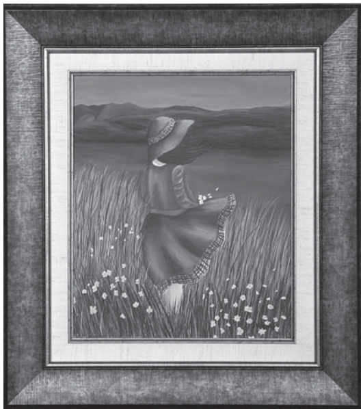
BRISE DU MATIN Acrylique sur toile, 10" x 12" Stéphanie Savard, inhalothérapeute