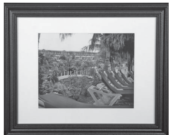
REPOS BLEU Photographie argentique 35 mm avec traitement numérique, 10" x 8" Sylvie Roy, brancardière