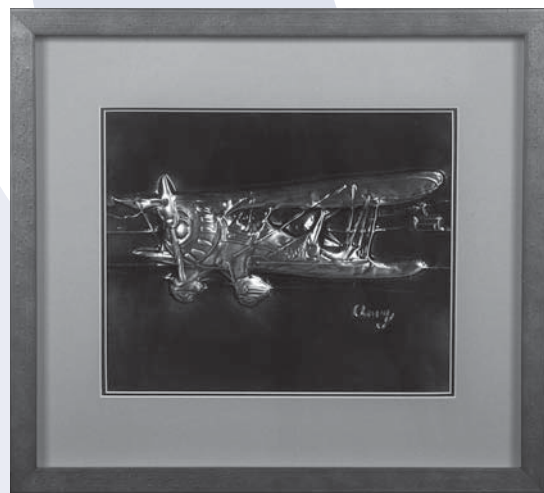
SOUVENIR DE 1929 Cuivre embossé, 10" x 8,5" Anny Morin, inhalothérapeute