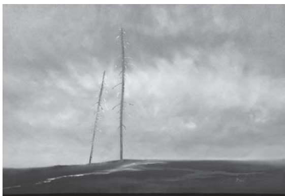
QUIÉTUDE Huile sur toile, 36" x 24" Denise Cloutier, technicienne en administration