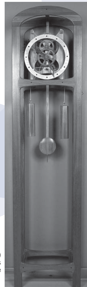
Horloge en bois (diverses essences) mouvement en bois Denis Martineau, analyste en informatique