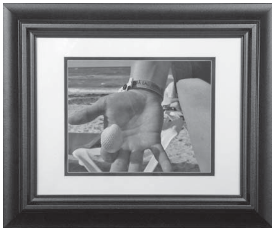
AUTO PORTRAIT DE MA MAIN Photographie argentique, 10" x 8" Sylvie Roy, brancardière