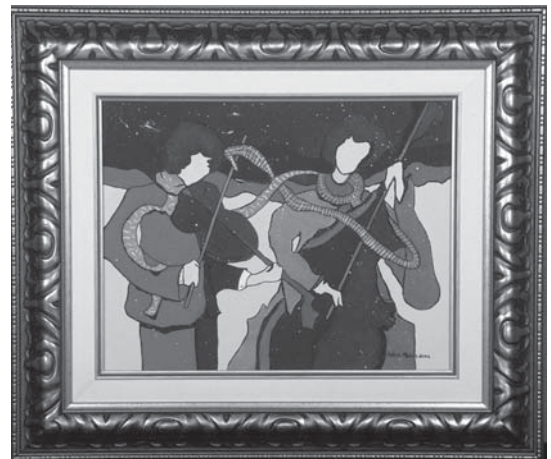
Huile sur toile, 14" x 11" Hélène Morin, agente administrative