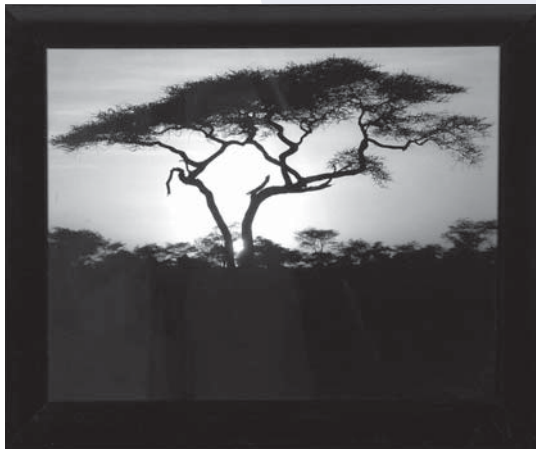
LEVER DE SOLEIL AFRICAÏN Photographie, 10" x 8" Kevin Matte, technicien en bâtiment