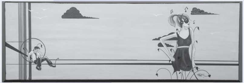
Acrylique et encre sur toile, 36" x 12" Martin Descarreaux, brancardier