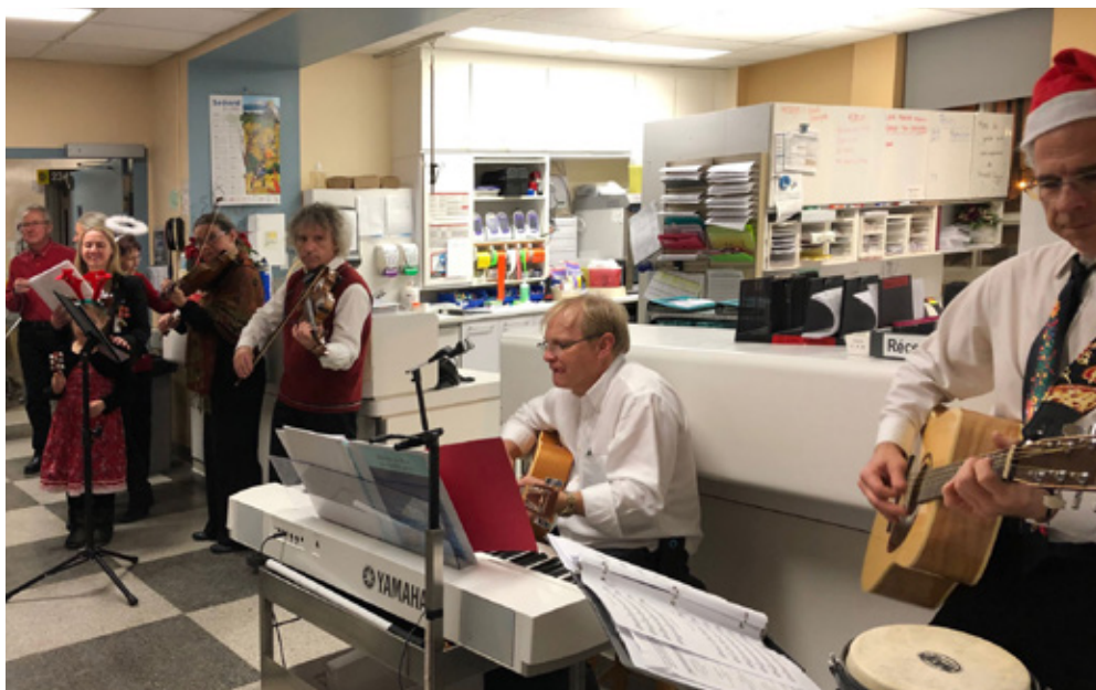
Bénévole et membres de la chorale de l'Institut