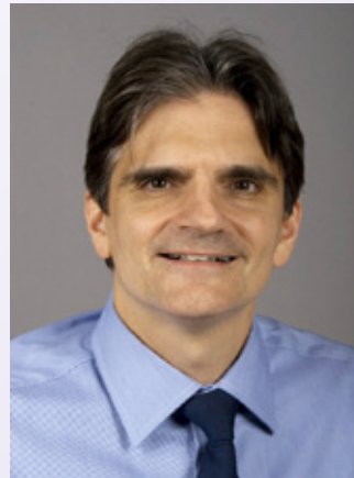
Dr Josep Rodés-Cabau

Le palmarès repose sur les citations récoltées par les chercheurs pour des articles scientifiques publiés depuis les douze dernières années et répertoriés dans la base de données Web of Science . Le score de chaque chercheur est établi à partir du nombre d'articles à son crédit qui figurent dans le premier percentile supérieur (1 %) des articles ayant récolté le plus de citations une année donnée.