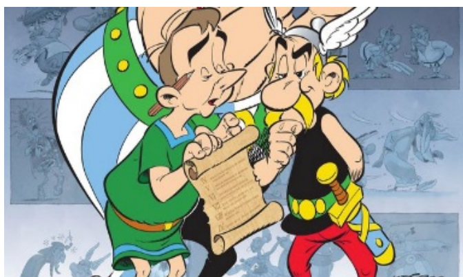
Dessin : Albert Uderzo (1959-2009)

Pour le centenaire, l'équipe du PPMC vous propose de relever un défi physique par mois au cours de l'année 2018. Présentez-vous à l'entrée du PPMC (côté ouest) le dernier mercredi de chaque mois de 12 h à 12 h 30. Inspiré des différentes épreuves du célèbre album Les 12 travaux d'Astérix , l'entraînement extérieur, d'une durée de 30 minutes, est ouvert à tous et il est adapté à votre condition physique.