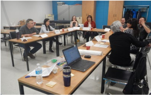
OPTIMISATION DU PROCESSUS DE RETRAITEMENT À L'UNITÉ DE RETRAITEMENT DES DISPOSITIFS MÉDICAUX (URDM)