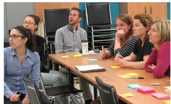
OPTIMISATION DU TRAVAIL SCAS (SERVICE CENTRALISÉ DES ADDITIFS AUX SOLUTÉS)