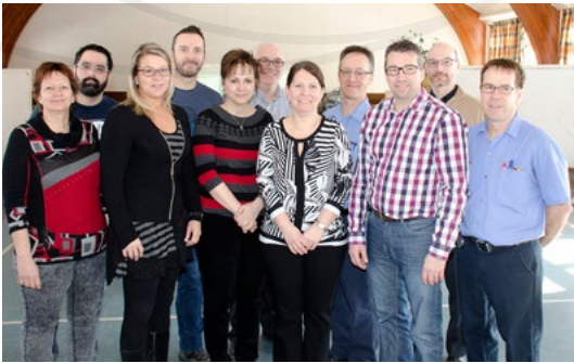
PROCESSUS DE RÉCEPTION , D'ASSIGNATION ET PRISE EN CHARGE D'UNE DEMANDE AUX INSTALLATIONS MATÉRIELLES