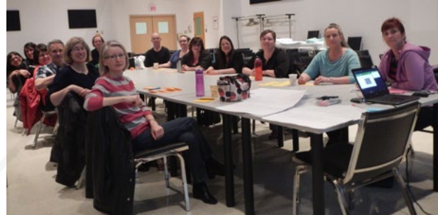
OPTIMISATION DE LA GESTION ET DE L'UTILISATION DE LA LINGERIE ET DE LA LITERIE