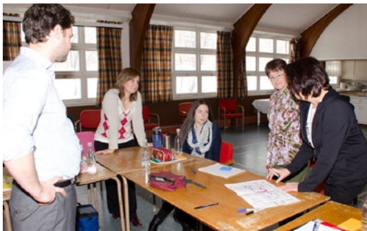
GESTION DE LA CORRESPONDANCE AUX ARCHIVES