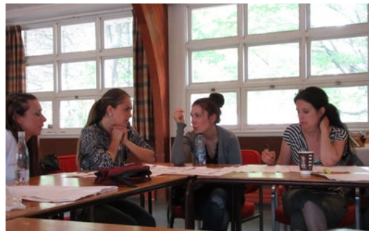
OPTIMISATION DE LA TRAJECTOIRE DES ÉCHANTILLONS AU LABORATOIRE D'HÉMATOLOGIE