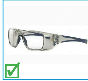
Lunettes de sécurité avec prescription