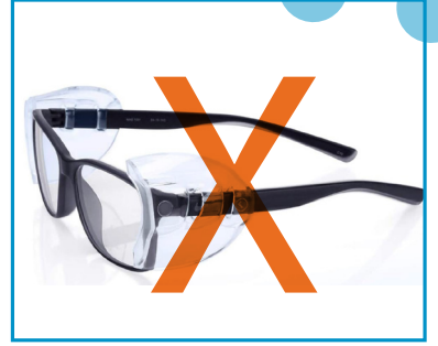
Protection latérale Lunettes d'ordonnance ne sont pas considérées équipements de protection