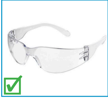
Lunettes de sécurité