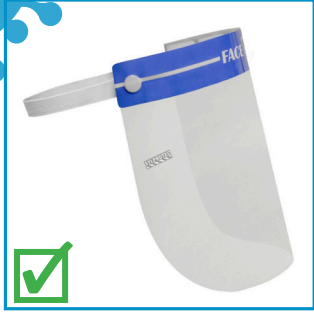
Visière jetable Priorité zone chaude