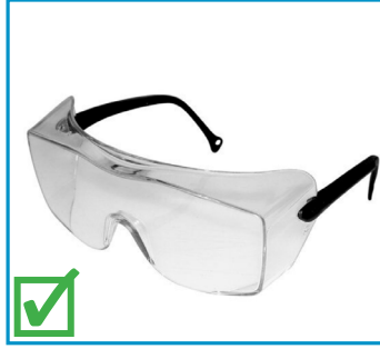
Sur lunettes de sécurité