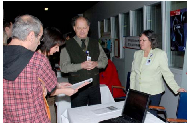
Les visiteurs ont pu poser des questions aux différents kiosques qui étaient installés au PPMC.