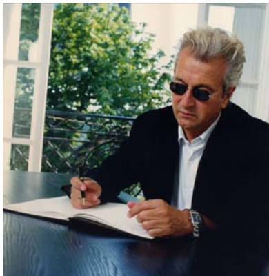
Invité d'honneur LUC PLAMONDON

Date : le mardi 15 avril à 19 h 30 Salle Albert-Rousseau