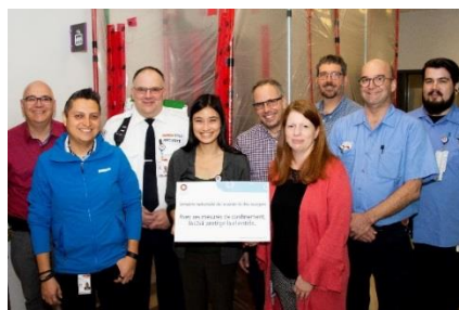
Installations matérielles et planification et coordination des projets